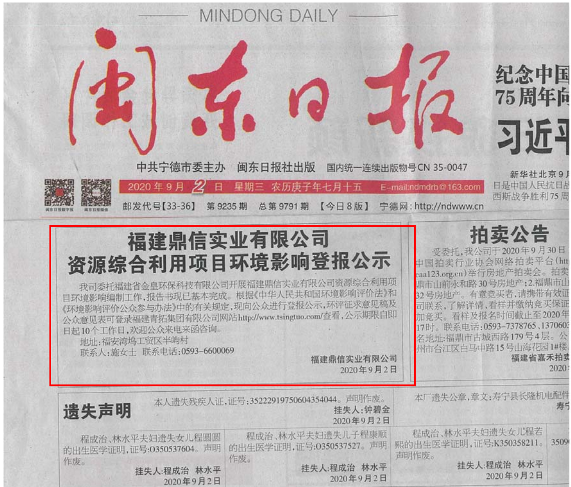
图 3.2.3 9月2日闽东日报公示图片